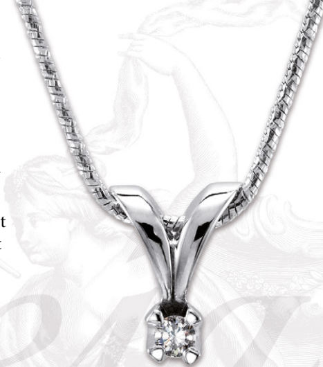
0.10 ct. W/si u/ kæde 3.550,-