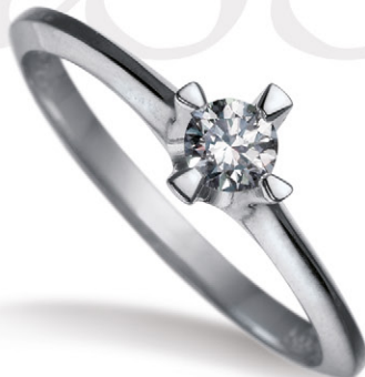
0.20 ct. W/si 8.900,-

Cassiopeia bytteserie er dansk design og består af énstensring, ørestikker og sløjfevedhæng.