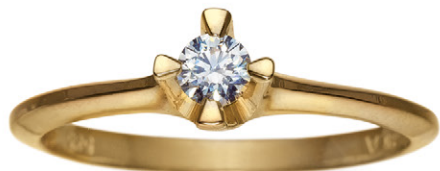
0.15 ct. W/si 6.600,-

Fås i 14 kt. rød- & hvidguld m/ brillanter Wesselton si fra 0.05 ct. til 1.00 ct. i trin à 0.05 ct.