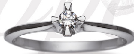
0.10 ct. W/si 5.200,-

Kig ind til din nærmeste guldsmed og få et byttetilbud på dit gamle guldsmykke – det betaler sig.