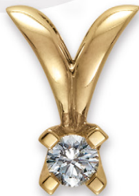
0.15 ct. W/si 5.300,-