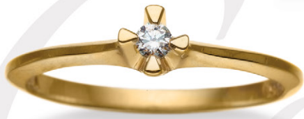
0.05 ct. W/si 3.150,-